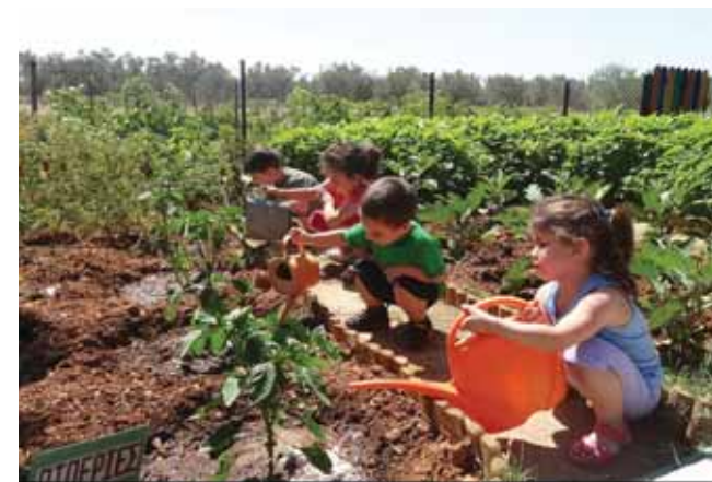
Πότισμα στο λαχανόκηπό μας.

μαθηματικά. Συνεχίζοντας το παιχνίδι του τρύγου στην αίθουσά μας κάνουμε Ιστορία - Μυθολογία με θεατρικό παιχνίδι τους θεούς του Ολύμπου και πρωταγωνιστή το θεό του Αμπελιού, τον Διόνυσο. Όλα με στολές από το βεσιτάριο που διαθέτει το “Ξεκίνημα”.