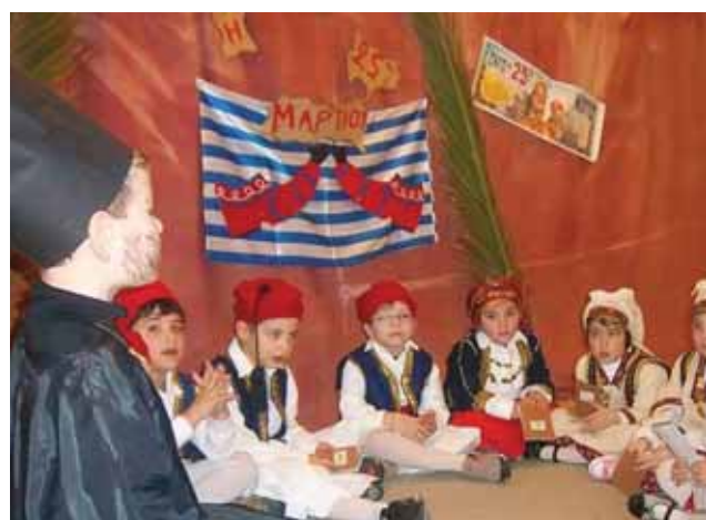
25η Μαρτίου - Κρυφό Σχολείο.

Ενα παράδειγμα με θέμα το Αμπέλι - Τρύγος - Πάτημα : Σεπτέμβρης: Επίσκεψη στο αμπέλι του “Ξεκινήματος” (φυσική ιστορία), να τρυγήσουμε (Δεξιότητες) με προετοιμασία ανάλογης ενδυμασίας: καπέλα, καλάθια κ.ά. Τα σταφύλια, τα πηγαίνουμε στο πατητήρι μας, πλένουμε τα πόδια μας, (Αγωγή υγείας), τα πατάμε, βλέπουμε το μούστο (Παρατηρητικότητα), ένα μέρος του το βάζουμε στα βαρέλια μας για κρασί (Χημεία), άλλο μέρος του το βράζουμε (Φυσικές Επιστήμες) για βραστό κρασί - πετιμέζι (Χημεία). Φτιάχνουμε μουσταλευριά - μουστοκούλουρα βλέποντας το υγρό (μούστος) να γίνεται στερεό (κουλούρι) {Χημεία}. Εδώ με τα υλικά της συνταγής κάνουμε