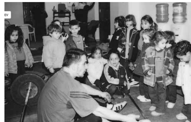
Ο Πύρρος Δήμας με τους μικρούς αρσιβαρίστες.

Εδώ, Κώστα, θέλω να κάνω μια επισήμανση. Όλα αυτά που σου είπα παραπάνω τα γνωρίζουν οι περισσότερες συναδέλφισσες Νηπιαγωγοί του Δημοσίου, από τις οποίες έχω πάρει πάρα πολλές ιδέες και προτάσεις με τα προγράμματα, που έκανα μαζί τους ως Προϊστάμενος στην Π.Ε. Όμως δεν μπορούν να τις υλοποιήσουν, γιατί δεν έχουν τις εγκαταστάσεις και την υποδομή που έχουμε εμείς στο “Ξεκίνημα”. Αυτή είναι και η επιθυμία μου. Να βοηθήσω και εγώ να γίνουν όλα τα Νηπιαγωγεία σαν το “Ξεκίνημα”