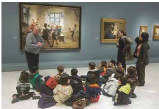
Επίσκεψη στην Εθνική Πινακοθήκη.

Χρ. Β.: Στο “Ξεκίνημα” χρησιμοποιούμε πρώτα τη μέθοδο “project” ή αλλιώς διεκπεραίωση προγράμματος που χαρακτηριστικό αυτής της μεθόδου είναι η συμμετοχή των παιδιών και των οικογενειών τους στην οργάνωση της εργασίας (Πρόγραμμα Π.Ε.) με συλλογικό πνεύμα δράσης, η οποία μπορεί να διεκπεραιώνεται παράλληλα με το