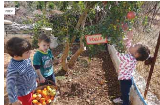
Συγκομιδή προϊόντων από το κτήμα μας.