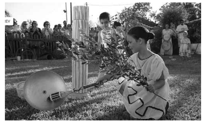
Αφή της Ολυμπιακής φλόγας στο σχολείο μας.

Αγοράσαμε λοιπόν το οικόπεδο μέσα στο κέντρο του Μεσογειακού κάμπου, με αποστάσεις από τις όμορες πόλεις (Κορωπί, Σπάτα, Παιανία, Μαρκόπουλο) μόλις 3 με 4 χλμ. Ένα κτήμα 4 στρεμμάτων. Εδώ στεγάσαμε το μεράκι και την αγάπη μας για τα παιδιά της προσχολικής ηλικίας. Το εξοπλίσαμε με πρωτότυπο παιδαγωγικό υλικό, επενδύσαμε γνώσεις και εμπειρίες πολλών χρόνων. Και οι δύο μας σπουδάσαμε την εκπαίδευση και ανήκουμε σ’ αυτήν. Κοινωνική Λειτουργός - Παιδοψυχολόγος η Καίτη - Δά-