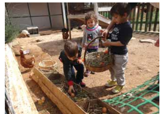
Αυγά από τις κοτούλες μας...

Επίσης, μπορώ να πω από την πείρα μου τα τελευταία 26 χρόνια στο “Ξεκίνημα”, ότι οι σύγχρονες έρευνες στο χώρο των επιστημών της αγωγής και της ψυχολογίας συνέβαλαν στο να αναγνωριστεί η σπουδαιότητα της Προ-