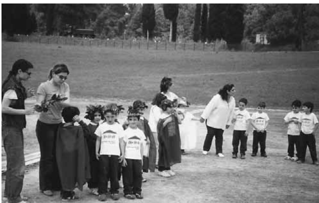
Αναβίωση αγώνων στην αρχαία Ολυμπία.

Στους χώρους του “Ξεκινήματος” υπάρχουν ζώα: κόττες, χήνες, πάπιες, κουνέλια, πουλιά κ.ά. ανάλογα με την εποχή και τη χρονιά. Τα φροντίζουν τα παιδιά όταν έχουν το ανάλογο θέμα και παίρνουν μόνο τα αυγά τους το ΠΑΣΧΑ. Την κοπριά τους τη βάζουμε στους κήπους μας μαζί με το ΚΟΜΠΟΣΤ που φτάνουμε στο μεγάλο λάκκο του σχολείου μας, από τις φλούδες των φρούτων του πρωινού μας και τα διάφορα φύλλα από σαλατικά και κλαδέματα.