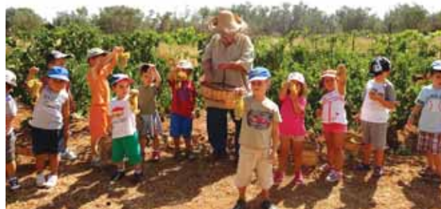
Τρύγος στο αμπέλι μας.

Χρ.Β.: Χρησιμοποιούμε το ολιστικό μοντέλο , που μας βοηθά μέσα από την εξέταση ενός θέματος να κάνουμε όλα τα μαθήματα παίζοντας, κάνοντας διάφορες δραστηριότητες βιωματικά.